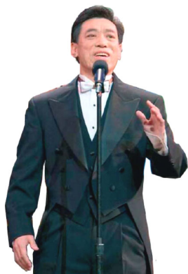
关贵敏在零八年全球华人新年晚会上演出

关贵敏，于 1978 年考入中央电影乐团成为专业歌手。他音域宽广、音色明亮纯厚，在歌唱界独树一格，是国家一级演员、著名男高音歌唱家。