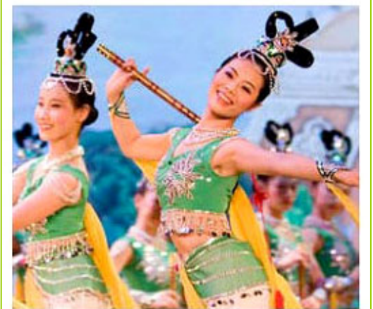
Tanz-Tradition aus dem Reich der Mitte

▲ 德国《柏林报》三月十三日用“最美的中国人从纽约来”为题，宣告神韵的到来。神韵艺术团由修炼法轮功的艺术家组成，致力于弘扬中华正统文化。