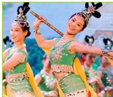
Tanz-Tradition aus dem Reich der Mitte