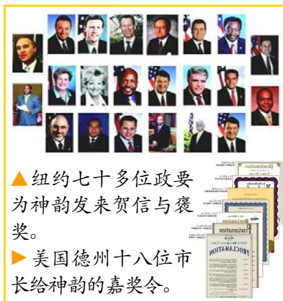
▲纽约七十多位政要为神韵发来贺信与褒奖。

期间还有一个插曲，二月六日《纽约时报》发表了一篇歪曲纽约神韵晚会的文章，然而这却起到了“广告”作用，相反使二月七日至九日的多场神韵晚会爆满。