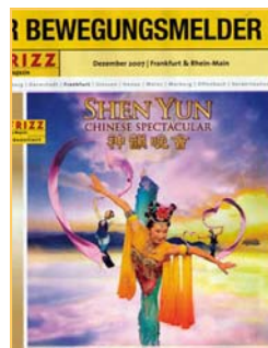
德国媒体《弗里兹》介绍神韵

澳大利亚《城市新闻》等报刊杂志纷纷赞美神韵晚会：给你带来无限享受，同时打动你的心灵。