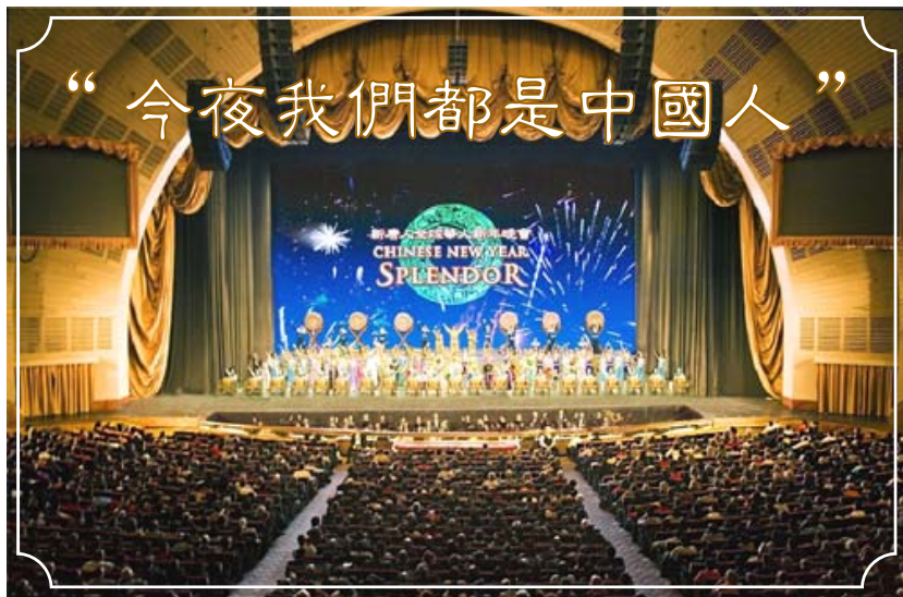
▲无线电音乐城全球华人新年晚会现场谢幕盛况。

2008年1月30日至2月9日，中国新年期间，由神韵纽约艺术团、神韵巡回艺术团和神韵乐队联合演出的全球华人新年晚会在纽约无线电音乐城隆重上演十五场，现场东西方观众