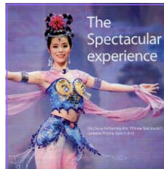
The Spectacular experience

澳大利亚《城市新闻》等报刊杂志纷纷赞美神韵晚会：给你带来无限享受，同时打动你的心灵。