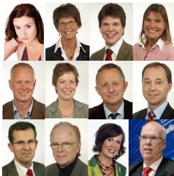
▲瑞典各党派政要致贺词，欢迎神韵。

《每日新闻报》、瑞典电视台等多家主流媒体对此予以揭露与谴责。瑞典各党二十五位议员联名共同向神韵发出贺信，七位联盟政府议员还特别发表将观看神韵的联合声明。民众更是纷纷买票进场观看，结果反促票房销售效应。