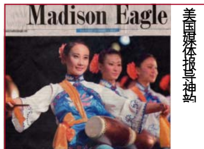
美国媒体报导神韵