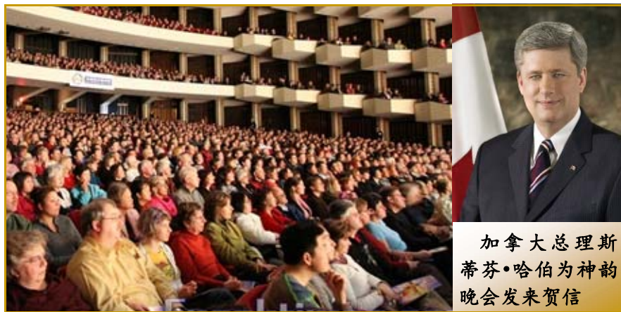
加拿大总理斯蒂芬·哈伯为神韵晚会发来贺信