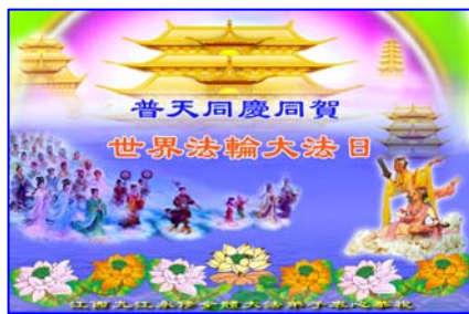
강남 9 강영수대법제자 드림