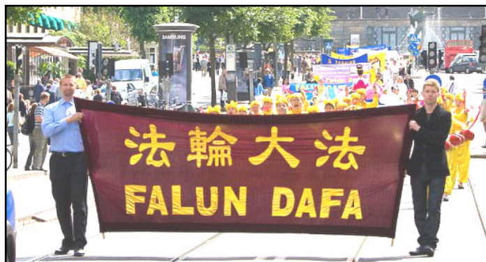
浩浩荡荡的法轮大法游行队伍

【明慧网】零八年六月二十八日下午，北欧法轮功学员在哥德堡市举行游行，抗议中共对法轮功长达九年的迫害，并声援三千九百万人退出中共。游行队伍由“法轮大法好”、“停止迫害法轮功”及“声援三千九百万勇士退出中共”三个方阵组成。游行队伍从哥德堡约达广场出发，穿过繁华的商业大街，途经老城及中国驻哥德堡领事馆，最后抵达终点站——古斯大夫·阿尔道福广场。