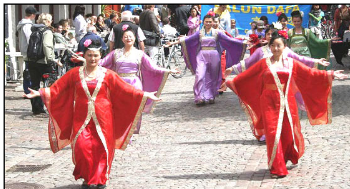
身着传统服饰的仙女队