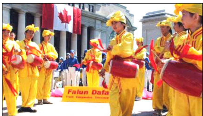
法轮功小弟子的腰鼓队表演