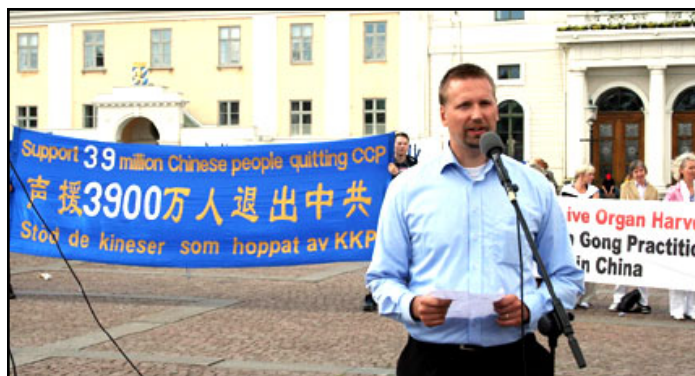
瑞典退党中心主任岳根·伯伊曼先生集会上发言