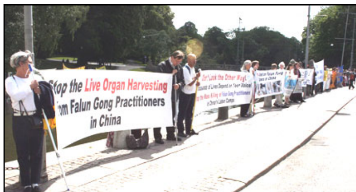
在瑞典哥德堡中领馆前集会抗议中共迫害法轮功