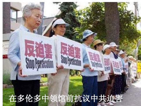
在多伦多中领馆前抗议中共迫害