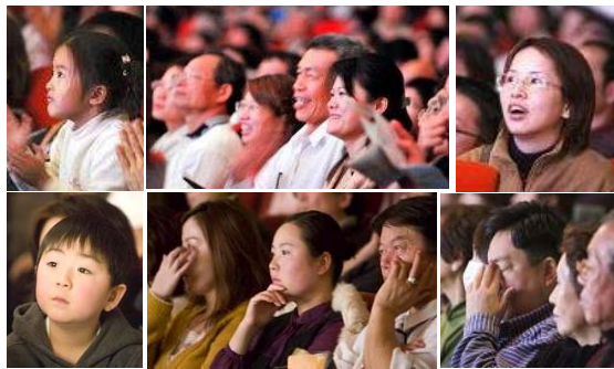
■ 神韵晚会华美灵动，内涵悠远，深深触动韩国(上图)和日本(下图)观众。

韩国十四位国会议员及大邱、首尔两大城市的多位市长、律师及艺术界、文化界等知名人士纷纷为神韵艺术团发表贺辞，盛赞神韵晚会是世界一流演出。日本前首相海部俊树等多位国会议员及各界名人纷纷致辞，赞赏神韵演出世界一流，并祝贺演出圆满成功。