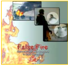
分析天安门自焚事件纪录片《伪火》获第51届哥伦布国际电影节电视荣誉奖

在大陆网民第一时间用互联网报导了失火消息的同时，中央电视台却没有及时转播，反而仍在报导澳洲火灾的消息。央视显然不是为公众服务的，而是中共邪党愚弄和欺骗民众的工具。