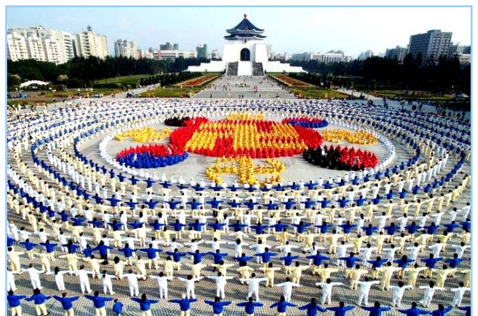
■ 2005 年 12 月 25 日，台湾 4000 多名法轮功学员集体炼功，排组法轮图形。