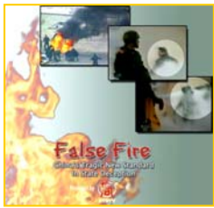
分析天安门自焚事件纪录片《伪火》获第51届哥伦布国际电影节电视荣誉奖

在大陆网民第一时间用互联网报导了失火消息的同时，中央电视台却没有及时转播，反而仍在报导澳洲火灾的消息。央视显然不是为公众服务的，而是中共邪党愚弄和欺骗民众的工具。