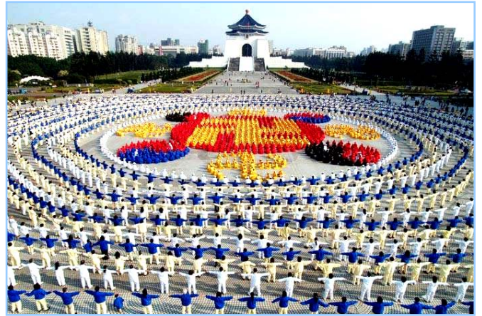
■ 2005年12月25日，台湾4000多名法轮功学员集体炼功，排组法轮图形。

● 洪传世界 法轮功迄今已洪传世界80多个国家和地区，受到世界人民的爱戴和尊敬。因李洪志先生和法轮大法对人类身心健康作出的杰出贡献，已获得各国政府褒奖、支持议案信函超过2977项。法轮功书籍被译成30多种语言。自2000年起，李洪志先生连续四年被提名诺贝尔和平奖。