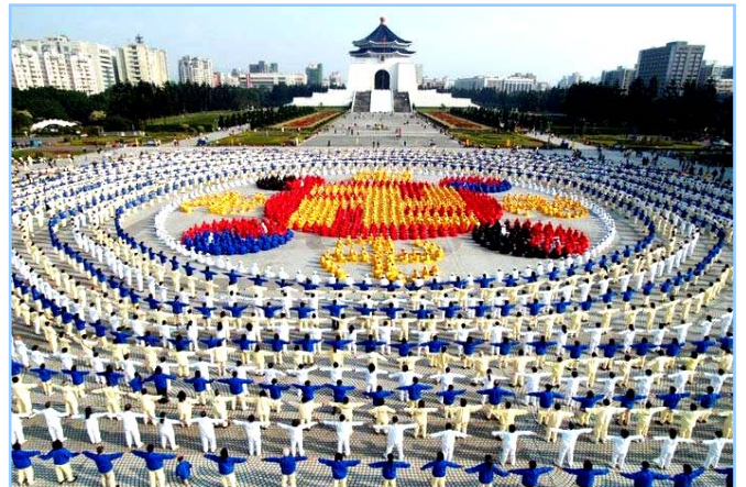
■ 2005年12月25日，台湾4000多名法轮功学员集体炼功，排组法轮图形。

● 洪传世界 法轮功迄今已洪传世界80多个国家和地区，受到世界人民的爱戴和尊敬。因李洪志先生和法轮大法对人类身心健康作出的杰出贡献，已获得各国政府褒奖、支持议案信函超过2977项。法轮功书籍被译成30多种语言。自2000年起，李洪志先生连续四年被提名诺贝尔和平奖。