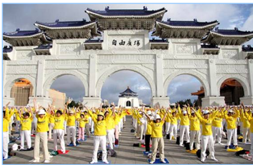
三千名法轮功学员在台湾自由广场炼功

为什么要炼功、为何要讲真相。但渐渐地她感受到我个性的转变，身体越来越好，也渐渐理