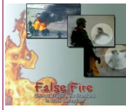
揭露自焚的影片《伪火》获第51届哥伦布国际电影节荣誉奖。