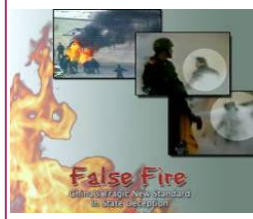
揭露自焚的影片《伪火》获第51届哥伦布国际电影节荣誉奖。