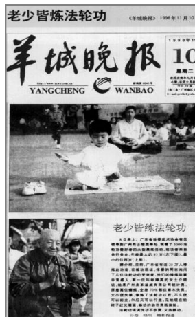
■中共迫害前大陆媒体的公正报道——《老少皆炼法轮功》

法轮功以真、善、忍为修炼原则，包括五套缓慢优美的功法动作，使修炼者身心健康，并能达到开智开慧。