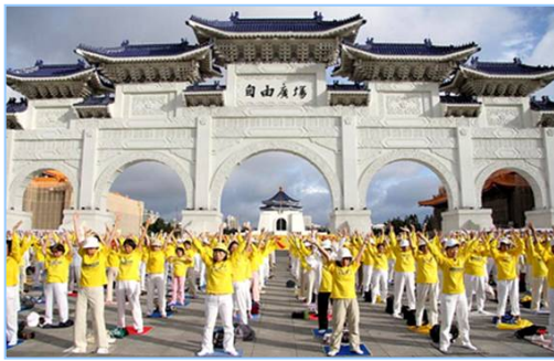
三千名法轮功学员在台湾自由广场炼功

为什么要炼功、为何要讲真相。但渐渐地她感受到我个性的转变，身体越来越好，也渐渐理