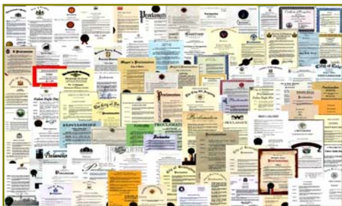
■法轮大法获各国政府褒奖、支持议案信函 3000 多项(至 2009 年 3 月)。

在这些现象的背后有没有深层的原因？有心人会发现许多问题，如：手无寸铁的法轮功为什么能抵挡住中共不