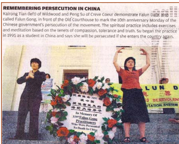
▲当地最大的报纸《圣路易斯邮报》以“记住发生在中国的迫害”为题作了报道

【明慧网】二零零九年的七月二十日，法轮功学员无辜遭中共残酷迫害长达十年之际，全球法轮功学员纷纷举行活动，让世人了解真相，呼吁共同结束中共的迫害。美国密苏里州法轮功学员在圣路易市中心、象征公正与自由的旧法院前，举办了反迫害集会。