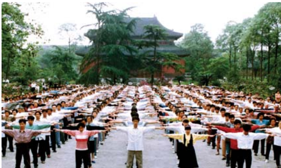
一九九八年四川成都法轮功学员集体炼功场的情形

● 使人健康 一九九八年五月十五日，国家体育总局局长伍绍祖亲赴法轮大法发祥地长春考察。九八年九月国家体总抽样调查法轮功修炼人一万二千五百五十三人，疾病痊愈和基本康复率为百分之七十七点五，加上好转者人数百分之二十点四，祛病健身总数有效率高达百分之九十七点九。平均每人每年节约医药费一千七百多元，每年共节约医药费二千一百多万元。