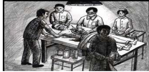
医生在沈阳军区总医院活体摘取法轮功学员器官

严刑拷打，身上已经有无数的伤疤，并且电棍电，她已经神智不清……神智不清，把她打得，已经就是，反正她又不吃东西，然后我们强行地给她灌牛奶，往她的胃里，她不喝就强行地给她灌。你知道那个，把她的鼻子捏上，于是维持着。她七天瘦了将近十五斤，经过体重。而这个时候不知道，可能是辽宁省公安厅某办公室，反正是一个挺保密的部门，派了两个，一个是解放军沈阳陆军总医院的一个军医，还有一个是第二军医大学毕业的，具体反正一个是岁数大的，一个年轻的，在某某，就是给她送精神病院的一个手术室，然后进行一套东西。不打任何麻药，刀在胸脯上，他们这个手啊一点抖都不抖，要是我下手我一定抖了。别看我在武警，我端过枪，我也进行过实弹演习。但是，我也见过很多死尸，但是看到他们，我真的“佩服”他们这些军医，手一点也不抖，直接戴着口罩拉出来。当时我们一人拿一把手枪在旁边站岗，这个时候已经拉开了，然后她就噉地大叫一声，那个女人就噉地大叫一声，说法轮大法好。