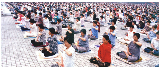
1998年5月，沈阳万名法轮功学员集体炼功

目前法轮功已弘传世界一百多个国家，超过一亿人修炼。法轮功书籍被翻译成三十多种文字在全世界发行。