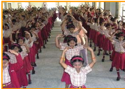
印度小学生正在炼法轮功第二套功法——法轮桩法

来自全印度的绩优私立校长到班加罗尔参加学校协会庆典，有两位校长发表了在学校推广法轮功的心得。其中一位说他修炼法轮功后，对身体心灵改变感到不可思议，于是推广至全校师生。很多难以管教的学生，自从炼法轮功后，不但变好了，功课更是普遍大幅进步，效果非常显著。◇