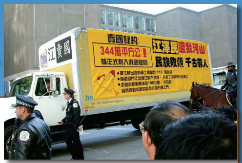
卖国事件曝光后，2002年10月江泽民访美，气愤的华侨开着一辆写着江泽民如何卖国等标语的车辆，对江卖国“穷追猛打”，从芝加哥一直追到休斯顿。

正因为如此，中国共产党在江西瑞金成立的苏维埃政权，其宪法第14条就明文规定：“中国境内所有的少数民族和地区，都有脱离中国、重建一个独立国家的权力。”