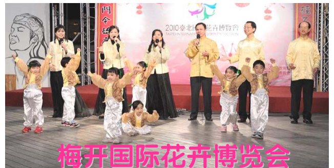
梅开国际花卉博览会

二零一零年国际花卉博览会于十一月六日在台北开幕，展期至四月二十五日，每天吸引数万人参观，台湾各地民众及大陆游客都慕名而来。