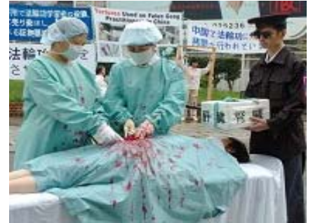
日本法轮功学员曝光中共活摘法轮功学员器官的罪行

2009年11月，西班牙国家法庭做出决定：以“群体灭绝罪”及“酷刑罪”，起诉江泽民、罗干、薄熙来、贾庆林、吴官正五名迫害法轮功的中共元凶。◇