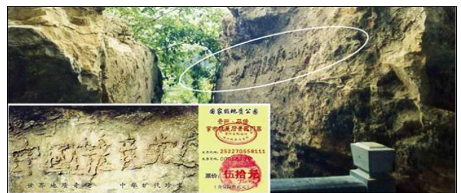
图为“藏字石”照片，小图为风景区门票。

当人们加入中共党、团、队，宣誓要为共产主义奋斗终身时。共产邪灵就在宣誓者的右手和额头上印上了一个印记（兽印）。灾难来时，首先淘汰这些人。只有退出共产党一切组织，神佛才会把这个兽的印记抹掉；心里想着法轮大法好，真善忍好，神自然知道这是个心地善良的人，灾难来临时就会保护你，使人逢凶化吉。所以说“三退保平安”。“三退”要有具体行动才算数，天看人心，你用化名、笔名、小名都可以。