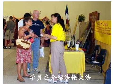
学员在介绍法轮大法

很多亚裔和西方人对炼功很感兴趣，表示打算去炼功点学炼功。有个西班牙语广播电台，为了给听众介绍法轮功，对法轮功学员进行了采访。下午三点左右，法轮功学员应邀演示了五套功法。亚洲节的主办方也表达了对法轮功学员的感谢和欢迎。