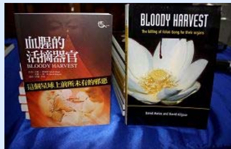
《血腥的活摘器官》中文版和英文版

左图：大卫·麦塔斯是著名人权律师，曾在二零零七年获得加拿大律师协会颁发的年度人权奖，二零零八年一月获得了加拿大马尼托巴省律师协会颁发的二零零八年杰出服务奖，二零零八年十二月三十日，获加拿大总督颁发的平民最高荣誉——加拿大勋章（Order of Canada）。