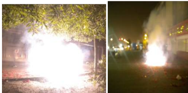
廊坊市夜晚街头正在燃放 “崩江”鞭炮。

红尘恶梦醒，世间烂鬼消。 摇摇红墙倒，三退潮更高。 声声扬正气，熠熠光正道。 今日喜相庆，未来更美好！