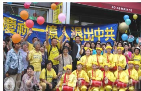
全球退党服务中心纽约总部

当初人们入党或者加入其附属组织共青团、少先队时, 发誓要把生命交给这个邪灵, 实际上就成了中共魔教的一员。当人们明白真相加入“退党大潮”时, 就是帮助人们摆脱中共, 以免成为中共被淘汰