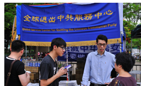
香港维多利亚公园退党服务中心