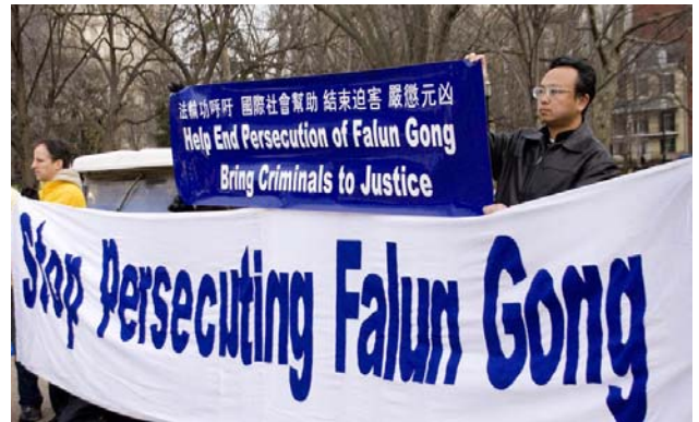
图：数百名法轮功学员聚集在白宫外静坐抗议中共迫害，要求法办迫害元凶江泽民等罪犯。

江的政治丑闻向国际社会曝光。美国国务院已经证实了这个消息。对此，美国华盛顿法轮大法佛学会做出了两点呼吁：希望美国政府公布王立军和美国领事馆谈话与迫害法轮功有关的内容；敦促习近平对近十二年来非法残酷迫害法轮功学员的中共官员进行调查，停止对法轮功的迫害，法办迫害法轮功的元凶江泽民等一伙罪犯。