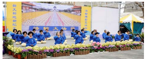
上图：法轮功学员在展示灯区向民众展示五套功法，图为第五套——神通加持法。

大地球花灯的主题是「大法洪传全世界」，意指法轮功由李洪志先生在一九九二年由中国传出后，至今已传至全球一百多个国家与地区，其中包含欧、美及日、韩、台湾等亚洲国家。