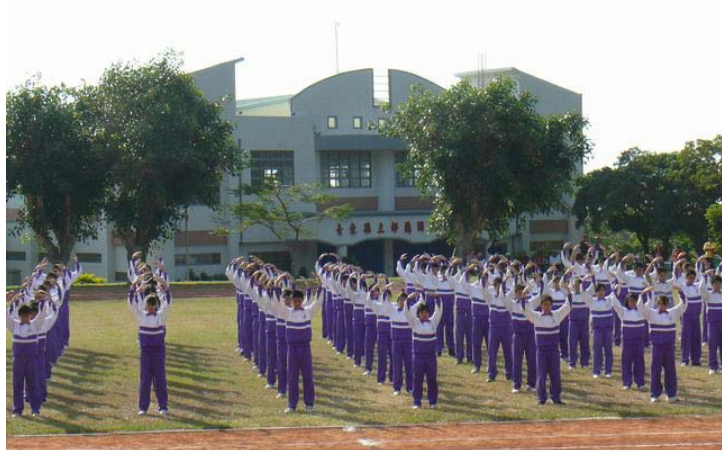
图：二零零九年十二月十一日，台湾台东县都兰国中校庆运动会开幕典礼上全校一百多位学生表演了法轮功五套功法，动作整齐、优美，让家长 and 来宾十分赞叹。