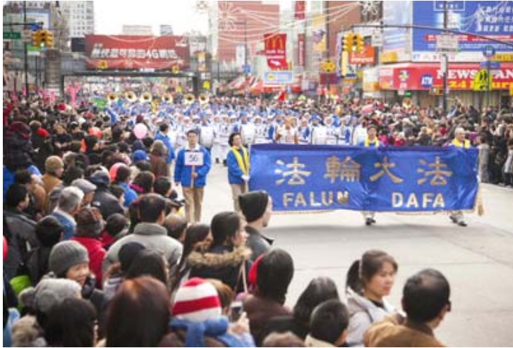
图：法轮功学员在纽约新年游行，受到热烈欢迎。

（明慧记者采菊纽约报道）二零一二年二月四日立春，纽约法拉盛街头一片喜气洋洋。街道两边挤满了人，大家满面春风，争睹法拉盛新年游行的盛况。法轮功学员的游行队伍阵容最庞大，以其壮观多姿的阵容，明亮美丽的色彩，发自肺腑的祝福赢得了众人的热烈欢迎。