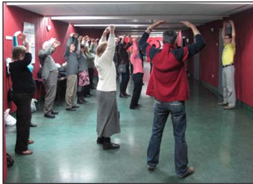
图：波兰民众学炼法轮功