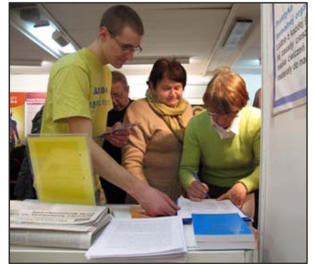
图：波兰民众签名反对中共迫害

台上索取相关资料，法轮功学员为此准备了波兰语、英文、德文、法文和中文等多语种法轮大法传单，让更多的人了解法轮大法。◇