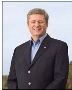
图：加拿大总理 斯蒂文·哈珀

加拿大总理、政府多次公开提出法轮功和人权问题。三月五日在日内瓦召开的联合国人权会议上，加拿大谴责世界各地发生的针对宗教团体骇人听闻的恶劣行为。在这些团体中，加外长提到了法轮功修炼者。◇