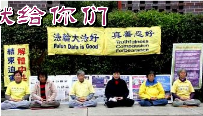
坚持在中领馆前讲真相的法轮功学员们