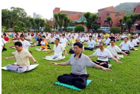
图：台湾北区法轮功学员晨炼

功之前，表面脾气温驯，实则很多枝微末节的小事都在心里忿忿不平，如：“为什么我做这么好没得到嘉奖，反而是他获得嘉奖？”有阵子，很多次类似的事情让他感觉很苦闷，气到想要辞职另谋高就，所幸那时开始修炼法轮功，他向内查找自己，发掘出自己那颗好强好胜、以及强烈的妒嫉心在作祟，因此忍受下来，并且对照法轮大法的教诲，一次次地去掉这些不好的思想，走了过来。