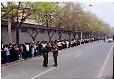
图：秩序井然的“四二五”上访民众

化、理念的破坏，代之以党文化对民众长期的洗脑，让很多人以为很多人去上访就如何如何，其实上访者只是在行使自己的合法权利。