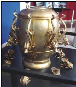
图：张衡发明了世界上第一台候风地动仪。

中华传统文化讲究天人合一，儒、释、道的修炼文化构成了中华文明的精粹，很多古代科学家同时也是修炼人，中国古代科技也因此在世界