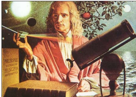
图：牛顿认为这个世界是神的杰作，正待科学家们去发现证实。