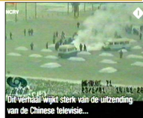
图：荷兰国家电视一台2005年3月14日《时事评论》专题播放法轮功节目，并揭露中央电视台“自焚”伪案，质疑突发事件中两辆警车为何备有（据中共媒体报导）20多个灭火器。

事实上，国际教育发展组织（IED）2001年8月14日在联合国会议上，就天安门“自焚”事件，强烈谴责中共的“国家恐怖主义行为”。声明说：从录像分析表明，整个事件是“政府一手导演的”。中国代表团面对确凿的证据，没有辩辞。该声明已被联合国备案。◇