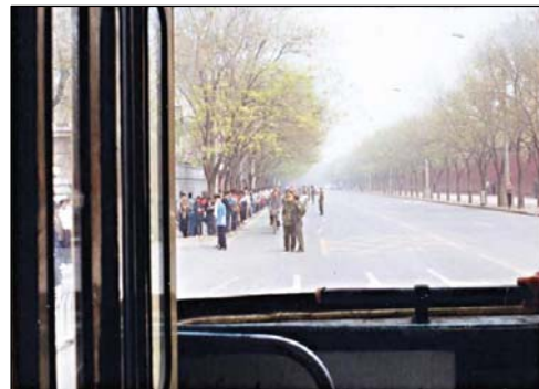
图：“4·25”当天在公共汽车中拍摄的上访人群和悠闲的警察。中南海的红墙在人群对面，街上能看到自行车行驶，根本不存在什么“围攻”。

他告诉我：“我先看看这些网站好吗？”语气中完全没有了那股强势，并充满了迫不及待的兴奋感。过了许久，我收到他传来的讯息：“你指引我看到光明！谢谢你！”我回了他一个微笑的表情。（文/小筱）◇