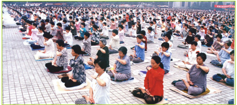
1998年5月，沈阳万名法轮功学员集体炼功

我们按着医生的治疗程序进行：第一化疗，第二手术，第三再化疗，第四放疗，第五、第六……没完没了，不知要把人折磨成什么样，能否熬得过来还是个未知数呢。但是我也管不了那么多了，就是砸锅卖铁也要给她治，她是我们全家的主心骨，可以说没有她我将无法独活，所以我们坚持做下去。但是在做到第三个疗程时，妻子简直是奄奄一息。