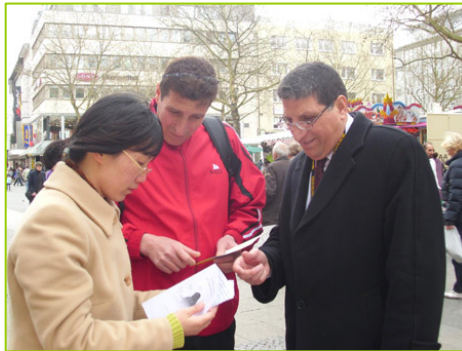
巴勒斯坦的世乒赛球员在听真相

德国多特蒙德市是一座体育名城，今年是第三次举办世乒赛，迎来了六万名来自超过一百四十个国家的参与者。世乒赛期间，很多国家的民众通过法轮功学员了解到，中国除了乒乓球有名外，更有一种气功受到欢迎，在中国曾有一亿人修炼，如今