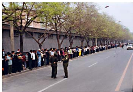
图：秩序井然的“四二五”上访民众

化、理念的破坏，代之以党文化对民众长期的洗脑，让很多人以为很多人去上访就如何如何，其实上访者只是在行使自己的合法权利。