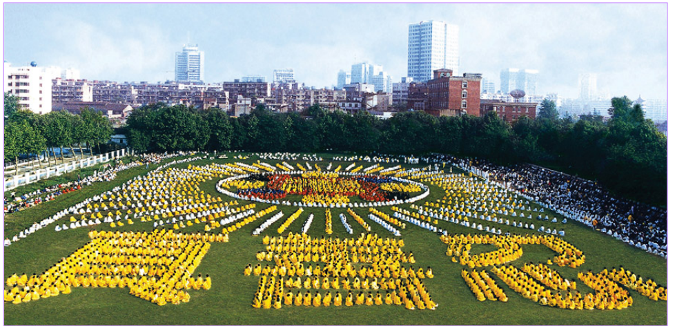
1997年，武汉5000多名法轮功学员集体炼功，列队组字。

只留了一个签名“法轮功学员”。工作人员要给她摄像报道，她没拍，回来也不声张。有一辜姓学员带着女儿捐款，她的绝症因炼功不翼而飞了，全家人都很感恩，女儿把自己的压岁钱都捐了出来。一位做生意的学员捐了一批衣服，居委会工作人员估了一下，价值一万多元，问她：你是怎么想的？她指着屋里“真、善、忍”匾说：我是按照这个法理来做的。居委会人员说：你是有钱，但有钱的人也不一定有善心啊，现今像你这样的人太少了！她说：我不是患得患失，是我师父教我这样做的。第二天她不在家，居委会人员把喜报贴在她家门