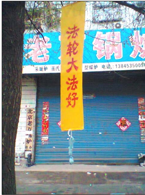
左上：河南省“天灭中共 三退保命” 左下：黑龙江牡丹江市“法办周永康” 中上：黑龙江牡丹江市“法轮大法好” 右上：东北某市城乡“普天同庆法轮大法弘传二十周年” 右下：广东梅州“世界需要真善忍”