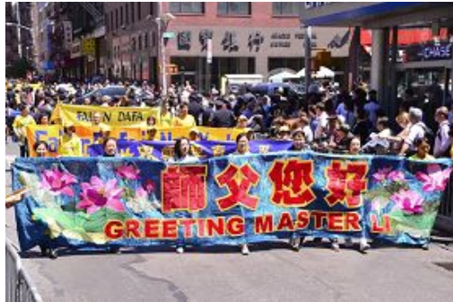
五月十二日，曼哈顿游行的游行队伍

“这时我给儿子写信：‘儿子不必惊慌，妈妈已有良方。’我让他再坚持一个月，回来我就教他炼