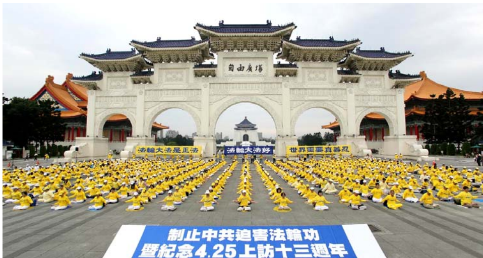
图：2012 年 4 月 22 日，台北自由广场上纪念“4·25”大上访十三周年活动。

先，并不是上访导致迫害。四二五上访本身是在依法反迫害，是中共江泽民的邪恶本性导致了迫害的发生。