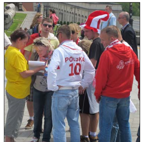
游客和各国球迷签名反对中共迫害

◎二零零零年的腊月，湖北浠水某地，几天大雨使清港的泥巴堵塞了通向集市的要道，无法通行，但没有人管。一位七十多岁的法轮功学员看到后，自己拿来铁锹，一锹锹地将泥巴挪到港边的岸上，干得大冬天脱了棉衣还浑身是汗。（接下页）