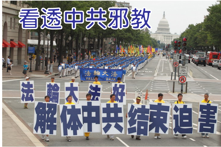
图：2012年7月13日，在美国首都华盛顿“解体中共、停止迫害法轮功”大游行中开头方阵。

更有甚者，近些年来，中共党内的一些官员又把邪恶的黑手伸向未成年少女，强奸处女成中共官员新时尚。前不久，媒体曝出河南永城市委办公