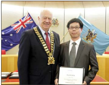
图：市长（左）在市政府议员会议上为法轮功团体代表颁奖

志先生于一九九二年五月传出的佛家上乘修炼大法，以“真、善、忍”为根本指导。经亿万人的修炼实践证明，法轮大法是大法大道，在把真正修炼的人带到高层次的同时，对稳定社会、提高人们的身体素质和道德水准，也起到了不可估量的正面作用。法轮功至今已弘传世界一百多个国家和地区，有上亿人修炼。◇