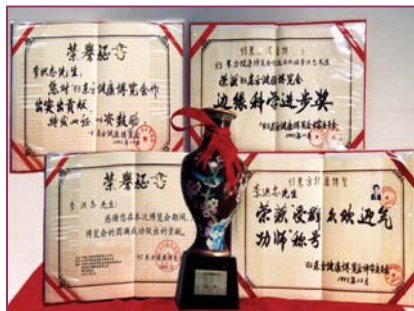
■ 李洪志大师荣获1993年健康博览会“边缘科学进步奖”和“受群众欢迎气功师”称号

● 法轮大法弘传世界 法轮功至今已弘传一百多个国家和地区，受到世界人民的爱戴和尊敬。李洪志先生和法轮大法因对人类身心健康做出的杰出贡献，获各国政府褒奖、支持议案和信函3000多项。法轮功书籍被译成30多种语言，在全球出版发行，可免费下载。法轮功在海外获得二千多项褒奖与支持议案。