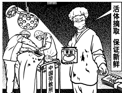
图：中国各地的劳教所活体摘取法轮功学员器官后，卖给医疗单位牟取暴利，然后将被害人送进“焚尸炉”毁尸灭迹。

良知、人性相违背，也是在违法，一旦司法形势拨乱反正，必将面临相应的惩罚。人做什么都是给自己做，一切皆有循环报应。眼下，在如何对待法轮功这个与良知碰撞的问题上，愿同胞们明智谋身，良知决断。◇