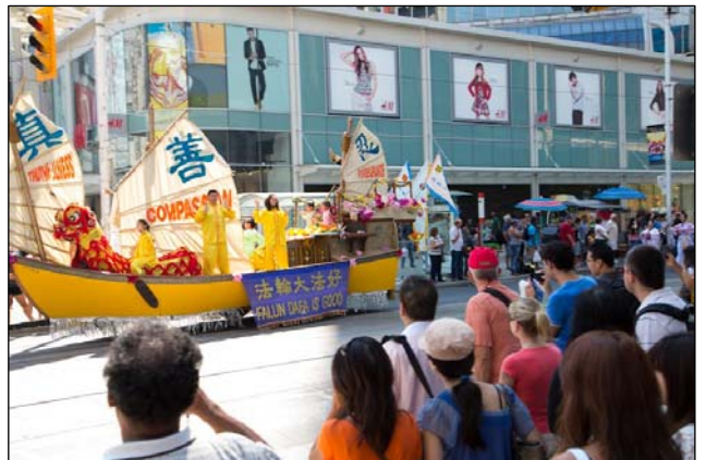
图：法轮功学员和民众在多伦多市中心举行大游行

权——正发生在中国的严重人权践踏。”他说，“随着越多人知道迫害，将会有越来越多的人与你们站在一起抗争，直到我们都有自由。”