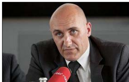
图：反强摘器官医生协会发言人法国医生金认为活摘器官完全背离医学原则

二零零六年三月初，中共在沈阳市苏家屯秘密集中营关押六千名法轮功学员并摘取活体器官的暴行被海外媒体曝光，英国器官移植学会伦理委员会主席史蒂芬·威格摩尔教授随即谴责在中国的器官移植是一项“无法接受”的侵犯人权行为，并呼吁联合国及世界卫生组织展开调查。