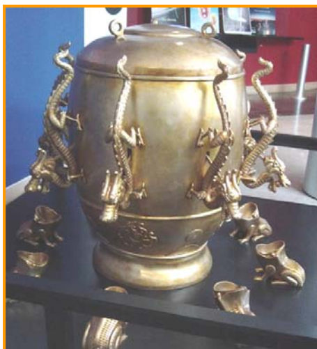
图：中国古代科学异常发达。东汉时期张衡发明了世界上第一台预测地震的候风地动仪，比欧洲早 1700 多年。

如果说宇宙万物是神创造的，那么一个人要探索宇宙的深层奥秘，就要信神敬神，按照神的要求修身养性，淡泊名利，提高自身的道德修为。