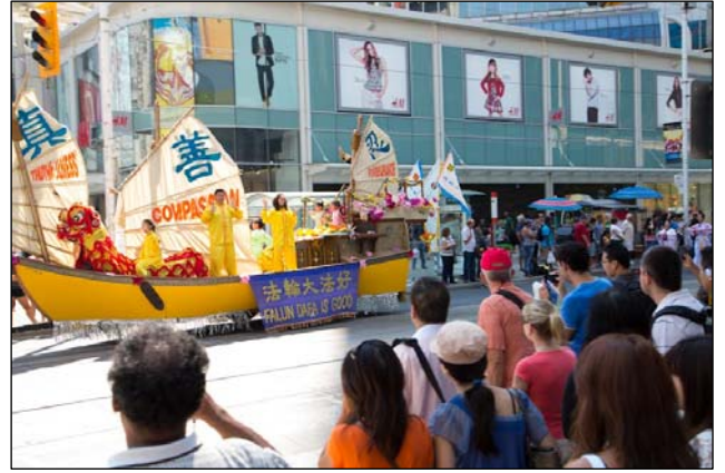
图：法轮功学员和民众在多伦多市中心举行大游行

权——正发生在中国的严重人权践踏。”他说，“随着越多人知道迫害，将会有越来越多的人与你们站在一起抗争，直到我们都有自由。”