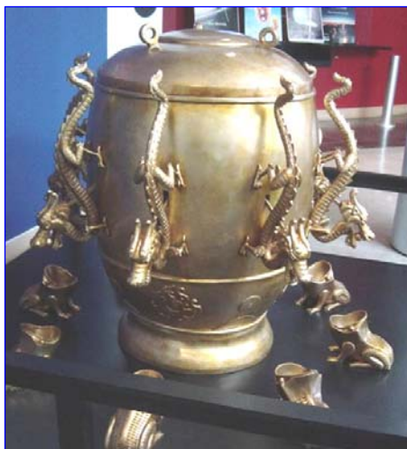
图：中国古代科学很发达。东汉时期张衡发明了世界上第一台预测地震的候风地动仪，比欧洲早 1700 多年。

如果说宇宙万物是神创造的，那么一个人要探索宇宙的深层奥秘，就要信神敬神，按照神的要求修身养性，淡泊名利，提高自身的道德修为。