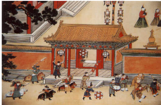
图：元宵节宫廷娱乐图

木、玉佩、丝穗、贝壳等材料, 经彩扎、裱糊、编结、刺绣、雕刻, 再配以剪纸、书画、诗词等装饰制作而成。按造型分, 有梅花灯、荷花灯、仙鹤灯、长鲸灯、玉兔灯等, 还有用灯彩堆叠悬缚而成的灯轮、灯树、灯楼、灯山等大型灯景。各种各样的灯, 形态千变万化, 不仅制作精美, 而且灯上画着著名的神仙故事和历史故事, 蕴涵着历史文化、伦理道德、审美意识、价值观念等丰富内容。届时君臣百姓都去观灯或猜灯谜, 传统文化的内在精神, 敬天敬神、从善如流、弘扬正气等道德理念深入人心, 使人从