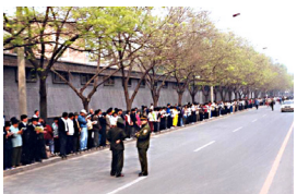
“4·25”法轮功学员上访现场