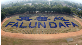
台湾3千名法轮功学员排字