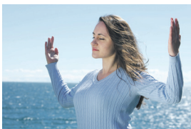
女孩沉浸在宁静的炼功中