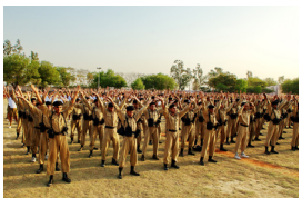
印度警察学校学生炼法轮功

法轮功是性命双修的佛家修炼功法。修“性”就是修“心性”，按照“真、善、忍”提高修炼人的道德水准；修“命”则是通过练习五套功法祛病健身，提高身体素质，延年益寿。