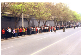
“4·25”法轮功学员上访现场

朋友，您能想像，以下的新闻出自于上海电视台吗？“今天一大早，上海体育中心人头攒动，本市近万名爱好法轮大法的炼功者会聚一处进行推广表演。法轮大法创始人李洪志师父于 92 年向社会公开传功讲法，受到广大群众的欢迎。”“全世界约有一亿人在学法轮大法。”这是中共迫害法轮大法之前，上海电视台 1998 年 11 月 24 日播出的一则新闻。