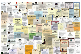
法轮功获世界各国各项褒奖