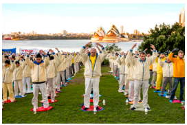
不同族裔法轮功学员在炼功

1992年5月13日，李洪志先生在中国长春将法轮大法传出。身心受益的人们为了纪念这个特殊的日子，把每年的5月13日定为“世界法轮大法日”。每逢此时，世界各地的法轮功学员纷纷举行各种庆祝活动，表达他们对李洪志先生的崇高敬意以及修炼法轮大法后重获新生的喜悦；各国政要也纷纷发出贺信，盛赞法轮大法。加拿大前总理哈珀连续10年为“世界法轮大法日”发来贺信，称赞说：“在过去的20多年间，全世界有无数的人受益于修炼法轮大法。法轮功的核心理念‘真、善、忍’，在我们的多元化文化社会中引起了强烈的共鸣。”