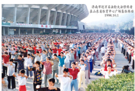
济南市法轮功学员在炼功

李有甫，曾是中国少数既有武术功底和气功功能，又有深厚理论的大师。1987 年，著名科学家钱学森组建人体科学研究所，对生命和特异功能等进行科学探讨，李有甫受邀担任副研究员。