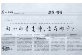
《昆山日报》刊登的文章