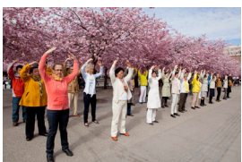
法轮功弘传欧洲 46 个国家

说到德国人，人们通常会想到他们的严谨刻板，要让他们接受一件新鲜事物可不那么容易。然而，法轮功在德国却和在其它众多国家一样受到人们的欢迎，几乎每个城市都有法轮功炼功点。