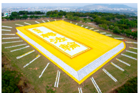
法轮功学员排出书的模型