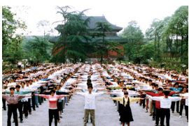
四川成都法轮功学员在炼功

俗话说“家有老是一宝”。老人是生活的源头，家有老人，孩子们便有了一个共同的归巢，无论离家多远，都会仰望自己的源头，找寻相聚的机会。可是，人生就像一场跋山涉水的旅行，经过了大半辈子的拼搏，到了晚年往往病痛缠身。那么，怎样才能有一个好身体呢？下面的这个“返老还童”的故事可能会引起您的思考与尝试吧。