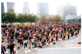
北京市法轮功学员在炼功

为了支持国家的气功活动，1992年12月，法轮功创始人李洪志大师率弟子参加在北京举办的东方健康博览会。在博览会上，李洪志大师用高功能为人治病，效果神奇。有位妇女被她丈夫搀扶而来，她腹中有瘤子，腹部肿胀得很大，看上去像十月怀胎的孕妇。李洪志大师当即给她调理，也就是20分钟左右的时间，她的肚子就瘪了，穿的裤子的裤腰这时都可以装进去两个她了。一时间，“法轮功神了！”的消息在参观的人群中不胫而走，轰动了整个北京城。