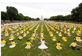
美国法轮功学员在集体炼功