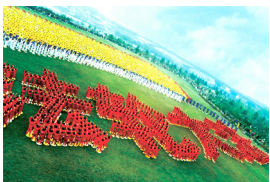
武汉近万名法轮功学员排字