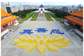
法轮功学员排出莲花图和字