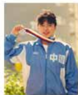
黄晓敏 奥运名将 前国家队运动员