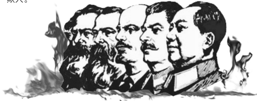
撒旦教 — 光照帮 — 马恩列斯毛 共产党的邪性一脉相承

这么一个撒旦黑帮创立了共产党，可见共产党的腐败是有源头的。现在中共的堕落和腐败完全失去了控制，相信共产党自己能整治腐败只能是自欺欺人。