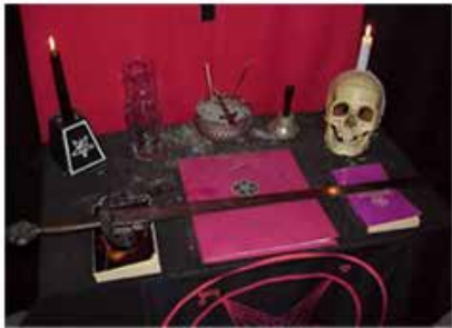
左图：撒旦教晋阶祭祀仪式中使用的长剑

“啊！我将黑血之剑，准确地插入你的灵魂，这是神不愿的。它从地狱的黑气里升腾入脑，令头脑发疯、令心魔变；我从黑暗之王手中将它换来！它为我打着节拍，并给我印记，我奏响浑厚美妙的死亡进行曲。”