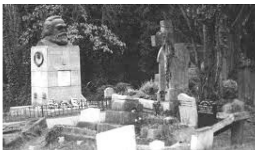
图：马克思死后埋在英国伦敦的高门墓地（Highgate Cemetery，大陆译为“海格特公墓”）。高门墓地是伦敦地区的撒旦崇拜中心，许多崇拜魔鬼的黑色仪式在这个墓地举行。