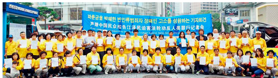
图：2015 年 7 月 13 日，韩国法轮功学员在中共驻韩大使馆前声援中国民众控告江泽民。韩国已有至少 116 名法轮功学员向中国最高检察院、最高法院邮寄了控告江泽民的“刑事控告状”。

2015 年 5 月 1 日，中国最高法院发布了“有案必立，有诉必理”的通告后，至今国内已有超过二十多万法轮功学员及家属向最高检察院和最高法院实名控告江泽民（从 2015 年 5 月底到 2016 年 10 月 25 日，明慧网已收到总数 209908 名法轮功学员及家属递交给中国最高检察院、法院的实名诉讼状副本。），提请最高检察院追究江泽民在迫害法轮功的责任中所犯下的罪恶，追究江泽民的刑事责任。