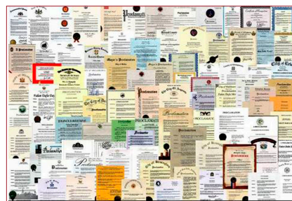
▲ 来自世界各国的部分褒奖。