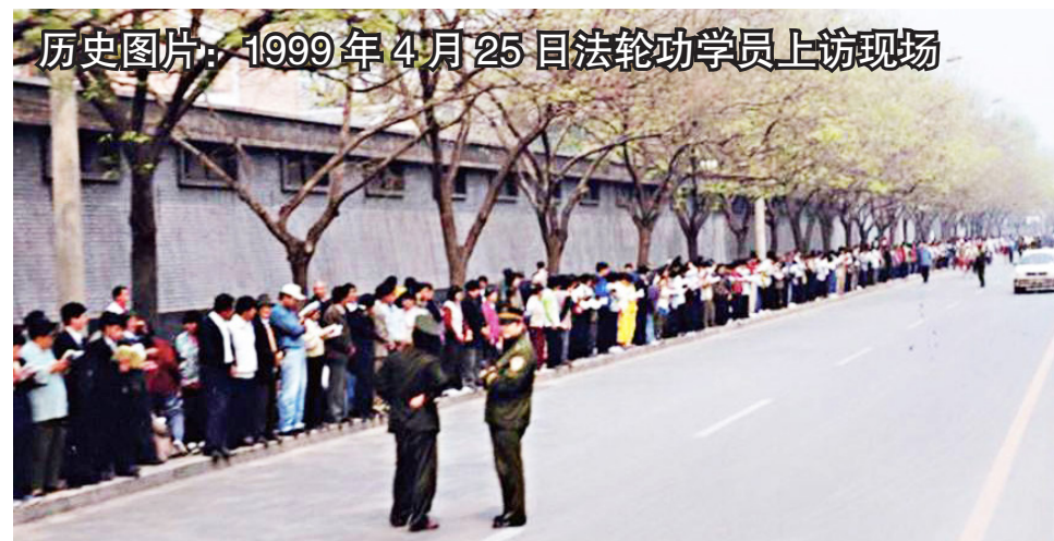
历史图片：1999 年 4 月 25 日法轮功学员上访现场

中国的民众太老实了，当权者逼迫他们“讲政治”，还随意利用“政治”这顶帽子打压老实的人们。