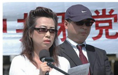
图：2006年4月20日，证人皮特和安妮，公开站出来指证中共大规模活体摘取法轮功学员器官牟取暴利的滔天罪恶。

● 中共第十七届政治局常委（2007-2012年）也是九人，其中贾庆林和李长春继续充当江泽民的帮凶，而周永康则是江泽民安排接替罗干的迫害法轮功的“前台总指挥”，也是最残酷迫害法轮功的四大元凶之一（其他三大元凶为江泽民、罗干与刘京）。他的迫害罪行极其严重，以致在海外多个国家被起诉。2014年7月29日，周永康落马，他的多名秘书和他在政法委系统、四川省和中石油的众多