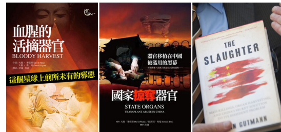
图：国际社会经过严谨的调查取证，出版：《血腥的活摘器官》、《国家掠夺器官》和《屠杀》（或译成《大屠杀》）三本书，详尽地证实了中共活摘法轮功学员器官贩卖的事实。