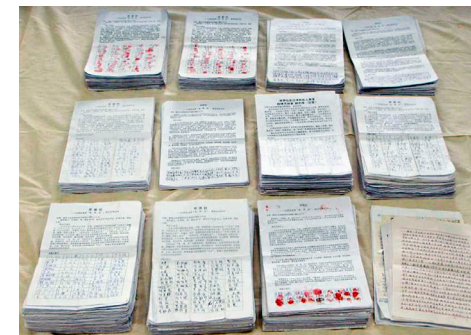
图：河北唐山 45193 人签名举报江泽民。

“全球声援中国民众控告江泽民的刑事举报联署活动”从 2015 年 7 月开始到 2017 年 12 月 8 日，已获得亚洲台湾、韩国、日本、港澳、新加坡、马来西亚、印尼共七个国家和地区，及欧洲 24 个国家，合计共 31 个国家及地区，超过 260 万（2,602,650）民众联署向中国最高法院和最高检察院举报江泽民。其中以台湾 92 万（926,286）人、韩国 67 万（671,422）人和日本 48 万（483,360）人为最多。