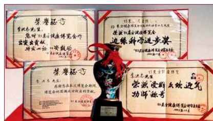
▲ 1993 年北京东方健康博览会上，李洪志先生荣获博览会最高奖项“边缘科学进步奖”。

● 弘传世界 法轮大法已弘传世界一百多个国家和地区，受到世界人民的爱戴和尊敬。因为李洪志先生和法轮大法对人类身心健康做出的杰出贡献，获各国政府褒奖、支持议案和信函 3500 多项。