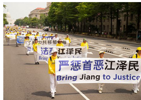
图：2017 年 7 月 20 日法轮功学员在美国首都华盛顿大游行。