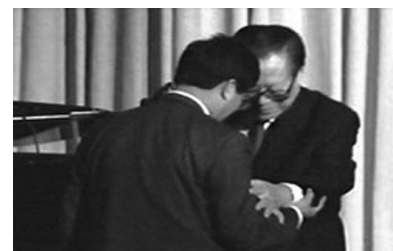
图：2002年10月，江泽民以私人身份访美时，被法轮功学员在芝加哥以群体灭绝罪、酷刑罪、反人类罪告上法庭，江泽民接到控告状时惊慌失措。

全球正义人士已组成“全球审江大联盟”，全球诉江案不断取得进展。2009年11月，西班牙国家法庭裁定，以群体灭绝罪及酷刑罪，起诉江泽民、罗干、薄熙来、贾庆林和吴官正等五名中共邪党高官，要求被告须在四到