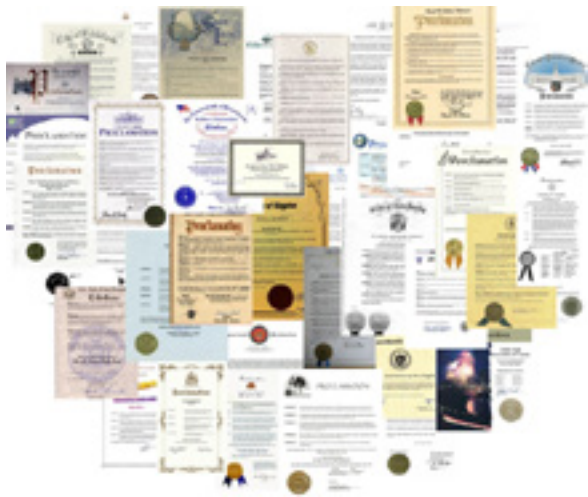
▲法轮功获各国政府褒奖、支持议案和信函 3650 多项。图为部分获奖证书。

法轮功“真、善、忍”的理念和修炼实践，获得了世界各国的认同和褒奖。在 1993 年北京东方健康博览会上，李洪志先生荣获最高奖“边缘科学进步奖”和“大会特别金奖”以及“受群众欢迎气功师”称号。迄今为止，法轮功获各国政府褒奖、支持议案和信函 3650 多项。短短 20 多年，法轮功弘传世界 100 多个国家和地区，上亿人修炼。法轮功主要著作《转法轮》被翻译成 39 种语言文字，是迄今为止被翻译成外国语言文字最多的中文书籍。