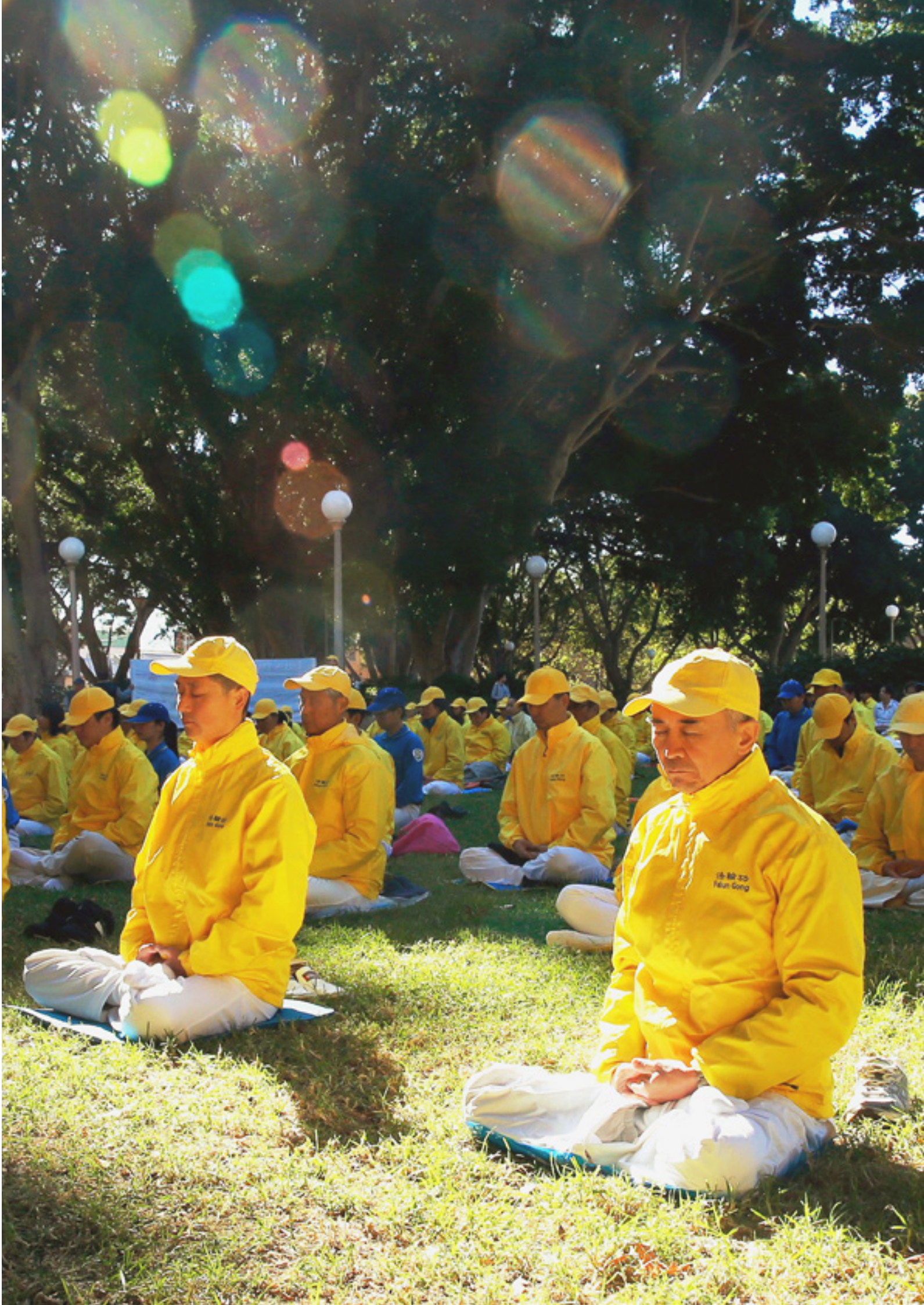
▶澳大利亚法轮功学员在修炼法轮功第五套功法——神通加持法。