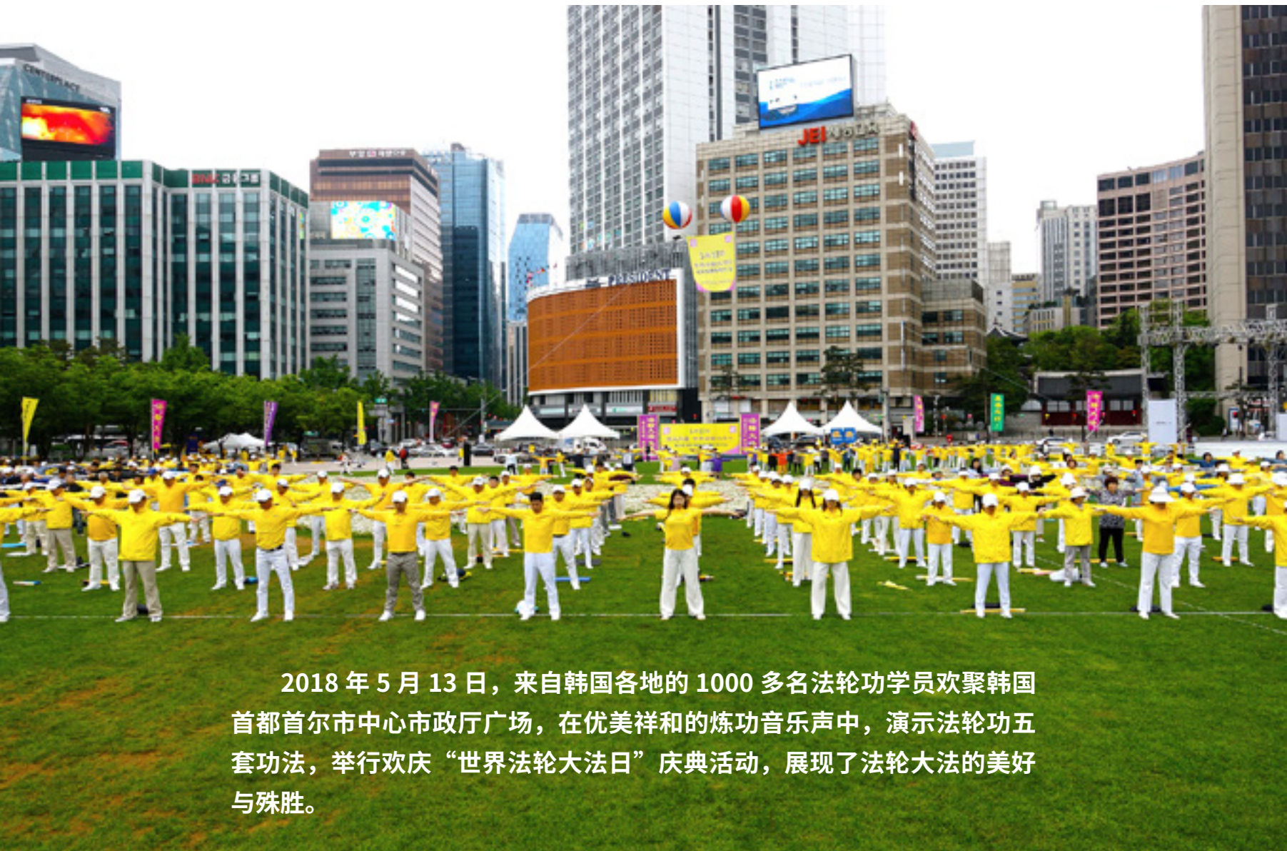
2018 年 5 月 13 日，来自韩国各地的 1000 多名法轮功学员欢聚韩国首都首尔市中心市政厅广场，在优美祥和的炼功音乐声中，演示法轮功五套功法，举行欢庆“世界法轮大法日”庆典活动，展现了法轮大法的美好与殊胜。