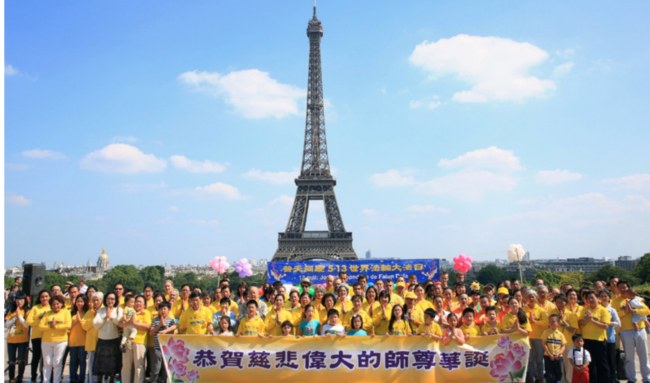
▲ 2018 年 5 月 20 日，在法国巴黎市人权广场上，法国法轮功学员打出写有“普天同庆 5·13 世界法轮大法日”、“恭贺慈悲伟大的师尊华诞”的横幅，举行庆祝世界法轮大法日活动，并进行了歌舞演出和功法演示。

法轮功“真、善、忍”的理念和修炼实践，也获得了澳洲社会的首肯。许多国会议员表示：澳洲已见证，法轮功受到各族人民的喜爱。法轮功“真、善、忍”的理念和修炼实践、祛病健身的神奇功效得到了社会认同。